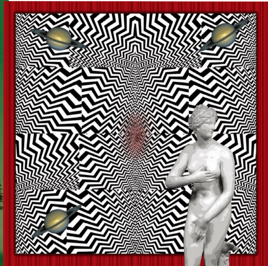
劇中的經典Red Room啟發了Gordon Robertson的《The Red Room》作品。